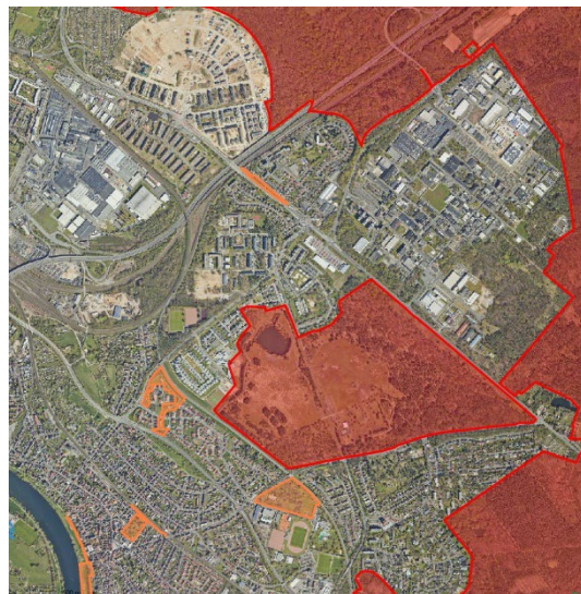
Ausschnitt Leinenzwang Großauheim / Wolfgang (orange – Ordnungsrecht, rot – Brut- und Setzzeit) z.B. Lindenaupark • Grünflächen Waldwiese • Mainaue Haggasse (1.4.- 31.10.) • Grünzug „Vor der Pulvermühle“ • Wege entlang von ausgewiesenen Liegewiesen am Mainufer