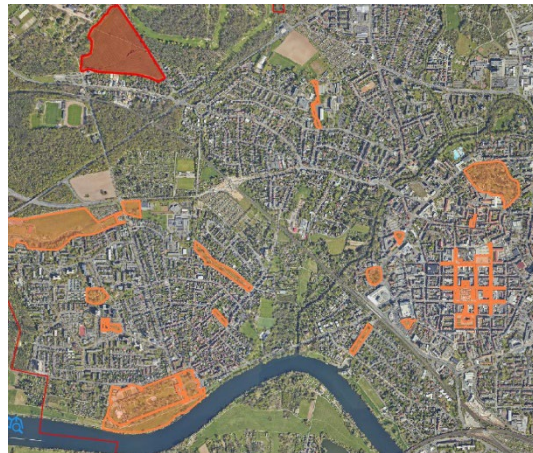
Ausschnitt Leinenzwang Innenstadt, Kesselstadt / Weststadt / Nordwest (orange – Ordnungsrecht, rot – Brut- und Setzzeit)

Alle Grünanlagen - Schlosspark Philippsruhe • Mainwiesen unterhalb Schloss zw. Gehweg und Spielplatz