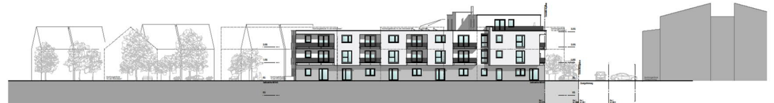
ANSICHT WEST -AN DEN MAINWIESEN-