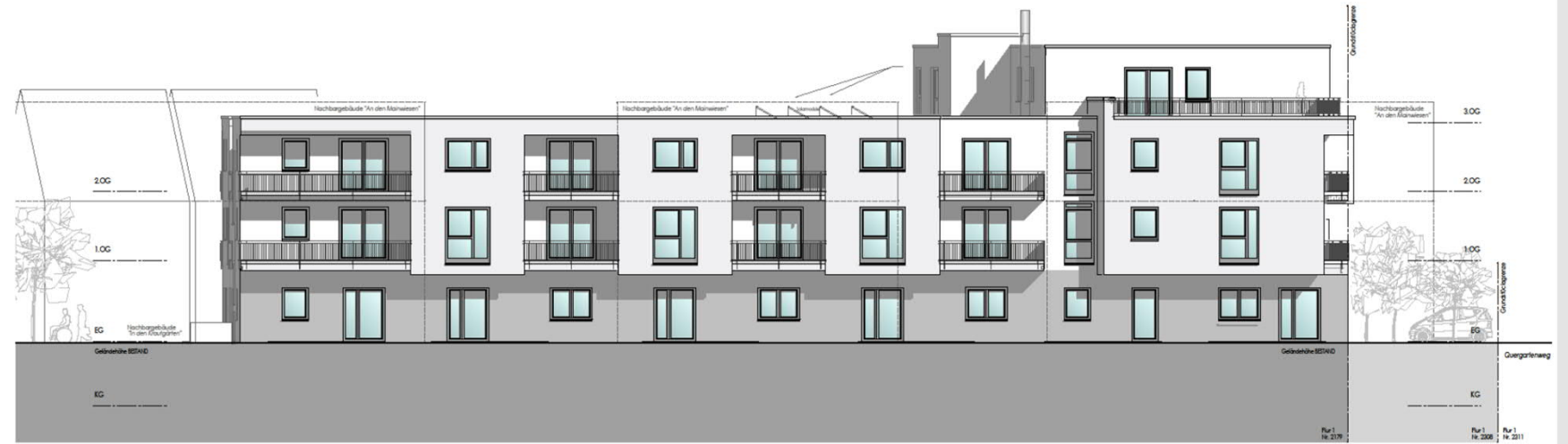
ANSICHT WEST -AN DEN MAINWIESEN-